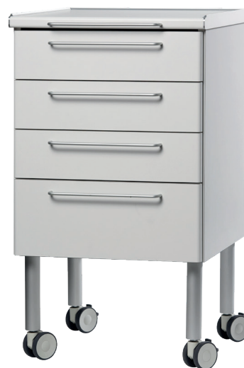
KF04 - bordplade i ståhøjde