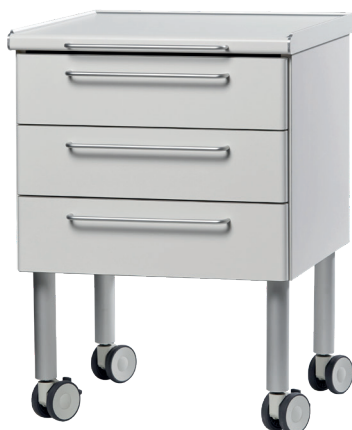
KF03 - bordplade i siddehøjde

Mobilskabene KF03 og KF04 er specialdesignet til professionelt brug i sundhedssektoren. Den robuste kvalitet sikrer, at skabene holder til intensivt brug i mange år. Begge leveres i ekstra kraftigt, hvidt højtrykslaminat med rengøringsvenlige bøjlegreb. Herudover har skabene solide hjul med bremse.