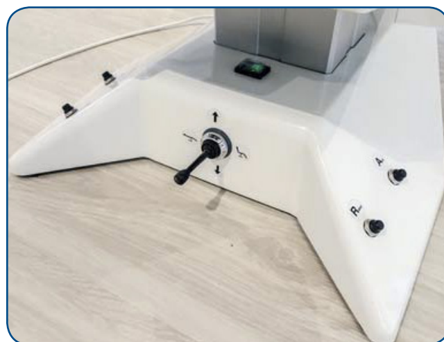
ill. 001 Fodtrykkontakt

R: Stolen kører retur til udgangsposition